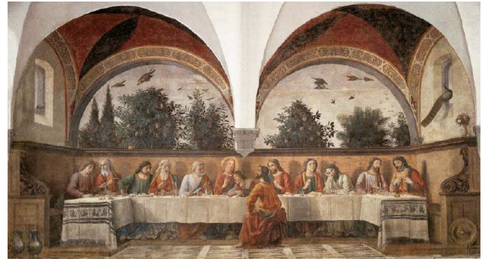
Ghirlandaios Sidste Nadver fra 1480 i kirken Ognisanti i Firenze. Til venstre kunstnerens forarbejde i form af en sinopia på sidevæggen i samme kirke

Kun få af datidens malermestre var belæste, og endnu færre var Bibelkyndige (det hellige skrift er den dag i dag ikke gængs læsning i ikke-evangeliske lande). Når de fik bestilling på et maleri af en bibelsk scene, så blev de omhyggeligt instrueret af ordregiveren eller dennes teologisk skolede rådgivere om ikonografien, dvs. reglerne for den billedlige udlægning af Bibelen, legenderne og den vedtagne symbol-ske betydning af personernes gestik, deres rekvisitter osv. Både kunstneren og bestilleren skævede og forholdt sig til tidligere værker med samme emne, og den endelige udformning diskuteredes så på grundlag