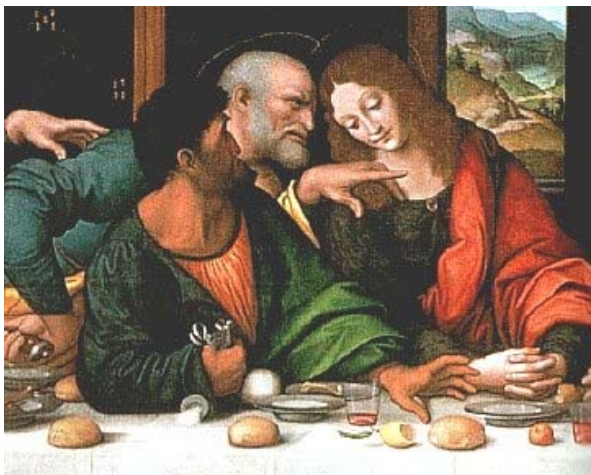
Det væltede saltkar foran Judas ses tydeligt på Giampietrinos kopi af Leonardos Sidste nadver

Selve opstillingen med langbordet – og opdækningen af det – er ikke epokegørende, heller ikke selve 'øjeblikket' eller illusionen af perspektivisk rumforlængelse fra refektoriet til ovensalen og ud gennem vinduerne til evigheden, om end rumproportionerne er genialt tænkt og minutiøst beregnet. Leonardo tænkte stort, og han gjorde det på grundlag af nøje studier og iagttagelser af de mindste detaljer. Det ser man på hans forarbejder til den sidste nadver: skitser af en legemsdel, et ansigtsudtryk, en bevægelse, en positur... Men især ved at placere Judas