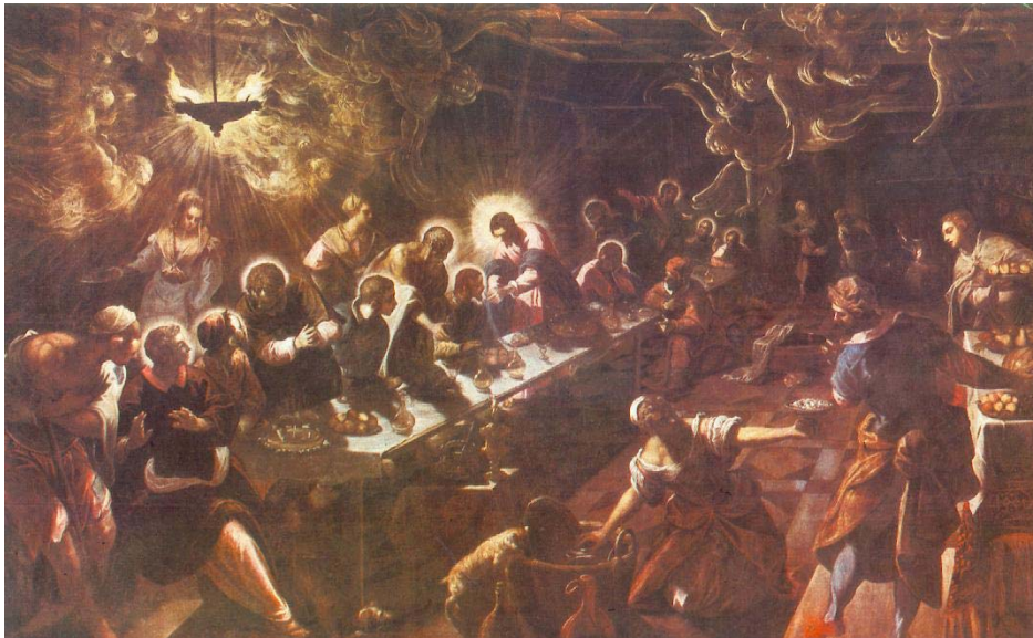
Tintoretto: Sidste nadver , 1594, S. Giorgio Maggiore, Venezia

Hvad den katolske kirkedomstol egentlig er på vagt overfor fremgår af spørgsmålet: »Har nogen givet Jer besked på, at I på dette billede skulle male tyskere og narre og lignende?» Reformerte forstår.