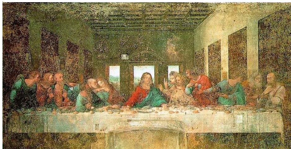
Leonardo da Vincis Sidste nadver fra 1498 i S. Maria delle Grazie i Milano

Denne nyoprettede kirkelige domstol var en censur-instans som med strenge midler kontrollerede at den rette lære blev udlagt på rette vis, også på teatret og i billedkunsten. De ikonografiske regler blev skær-