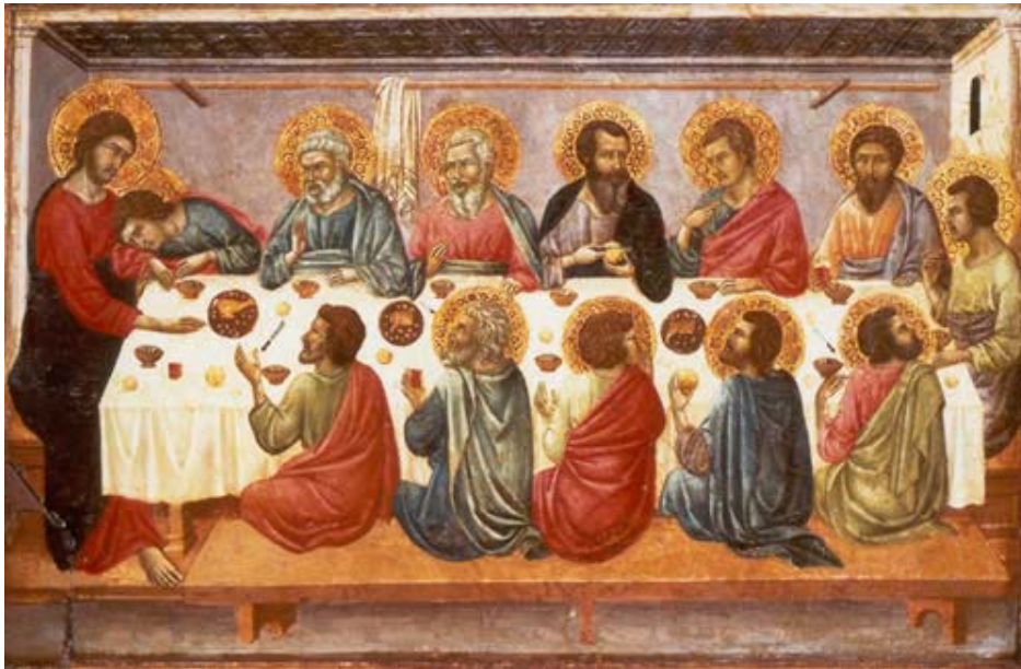
Ugolino di Nerio: Den sidste Nadver , ca. 1327-30, The Metropolitan Museum, New York

Det var skærtorsdag aften, at Jesus for sidste gang bød sine disciple på et måltid mad. Og det var ved den lejlighed han afslørede for sine venner at en af dem snart ville forråde ham. Vild opstandelse. Straks efter at Judas har modtaget brødet af Herrens hånd, forlader han selskabet for at gøre, hvad han skal. Derefter indstifter Jesus nadverens sakramente med de famøse ord: »Dette er mit legeme« og »Dette er mit blod«, om henholdsvis brødet og vinen, de ord der siden hen skulle give så mange fred i sjælen – og volde så megen ufred og ufordragelighed i verden. »Den, som æder mit kød og drikker mit blod, har evigt liv,« siger han ifølge evangelisten Johannes (6,54). Det er det glade påskebudskab. Men hvordan skulle de ord fortolkes, især med henblik på altergangen? Symbolsk eller bogstaveligt – eller hvad?