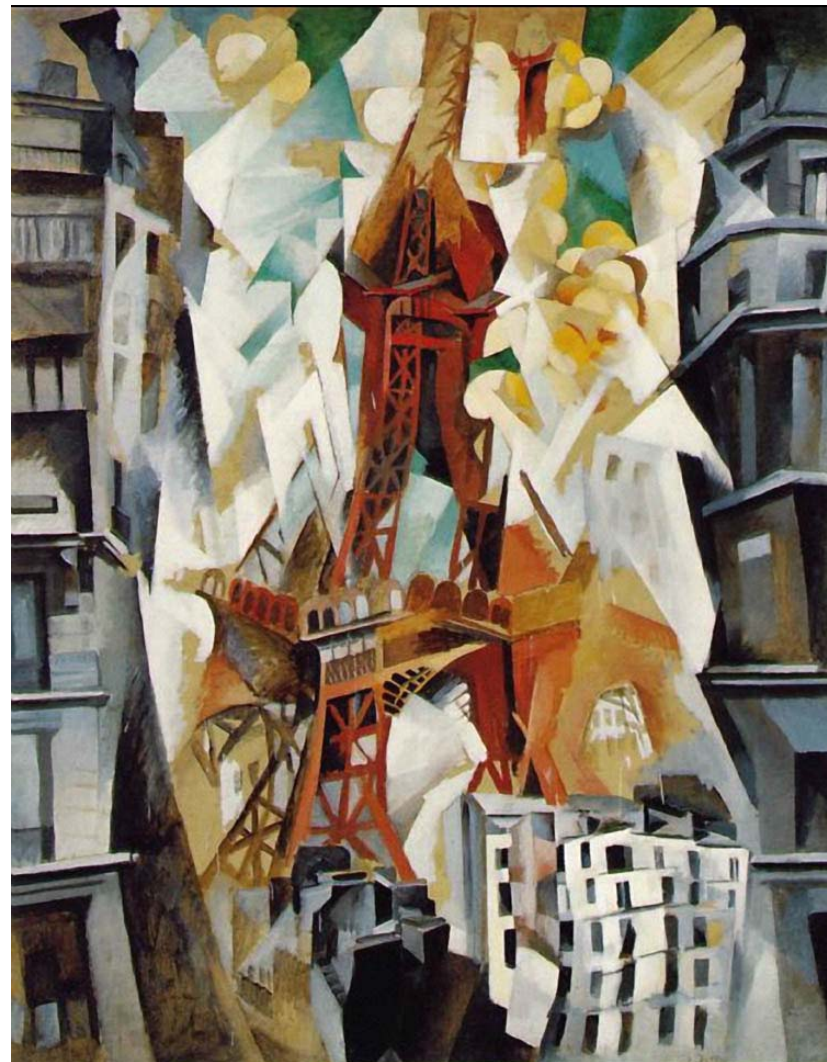
Robert Deleuney, Det røde Eiffeltårn , 1911

Men lad os ikke – når vi skal forstå de bagvedliggende bevidsthedsformer – vige tilbage for at skæve til andre fagområder og give os i snak med historikere, biologer, religionssociologer, fremtidforskere, geografer, teknologer, etnologer... Produktivkræfter og produktionsforhold, mentalitet og ideologi må med i billedet. Ideologi forstået som den individuelt og socialt betingede bevidsthedsdannelse, mentalitet som en mere eller mindre fælles og ubevidst oplevelses- og opfattelsesmåde (fælles for Cæsar og hans ringe-