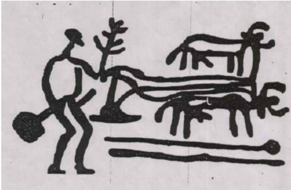
Helleristning, ca. 1.000 fvt., Bohuslän, Sverige.

I Nordskandinavien er der helleristninger af samme magisk-naturalistiske karakter som hulemalerierne i Sydeuropa. Men de mest kendte helleristninger stammer fra et senere tidspunkt (o. 1500-900 fvt.), da menneskene i Norden havde dyrket jorden i mere end 2000 år. Mange motiver er hentet fra dagligdagen i landbrugssamfundet, f.eks. en mand der er i færd med at pløje med en ard, trukket af et par okser. Men de fremstillede scener er alt andet end naturalistisk vellignende. De levende væsner er stiliserede, geometriske figurer, der i en kultisk sammenhæng udtrykker forholdet mellem mennesket og en højere magt: frugtbarheden stritter symbolsk og overdimensioneret fra mennesker og dyr.